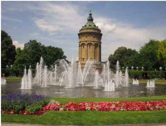
Der Wasserturm ist das Wahrzeichen der Quadratestadt Mannheim und nur einer von vielen schönen Gründen nach Mannheim zu kommen...

Herzlich willkommen in der Steuerberatungskanzlei Jens Jaschek!