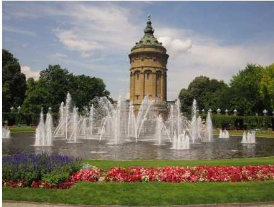
Der Wasserturm ist das Wahrzeichen der Quadratestadt Mannheim und nur einer von vielen schönen Gründen nach Mannheim zu kommen...

Herzlich willkommen in der Steuerberatungskanzlei Jens Jaschek!